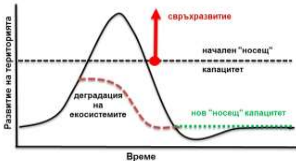
Фиг. 3. Същност на концепцията за "носец капацитет"

1) Съобразяване на туристическото развитие с потенциала на съответната територия. Необходимо е да се установят количествените стойности на показателя „носец капацитет“ (carrying capacity).